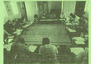
企画を検討する会議(5/19)