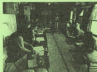
深沢サロンでのサポートチームの活動(5/17)