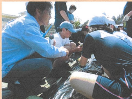
<授業参観5・6年農業科>