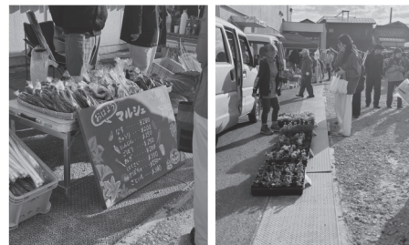
過去の開催の様子

「喜多方おはようマルシェ」は、朝ラー文化が根付くこの街で「休日を朝から楽しむ」をコンセプトに開催します。会場だけでなく街の店舗や軒先を舞台に、ラーメンから始まる新しい回遊の形をご提案。点（店）を線（歩み）に変え、街全体が賑わう特別な朝を創り出します。