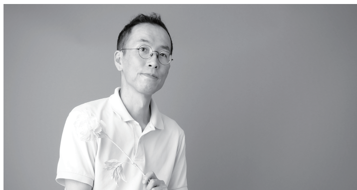
セルフポートレートスタジオ（喜多方）でカッコつけてみました。