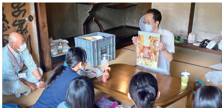
近頃学校で取り上げられている「探究」学習を広めています。