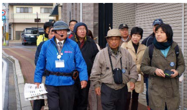
おたづき蔵めぐり

地元高校生と共に、古写真収集を行い、昔と今を比較した写真展を開催しました。古写真は未来へと歴史を繋ぐ貴重な資料です。