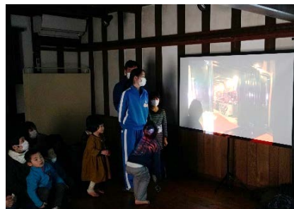
撮影した地区の宝をプレゼン

特定物件であることを示すサインプレートのデザインに地域の歴史や住民の方の思いを落とし込み、価値の再発見や地域の誇りに繋がるサインプレートを作成します。