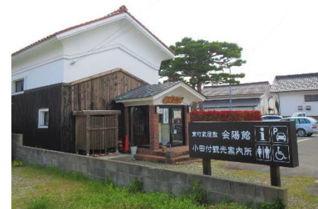
小田付観光案内所・交流スペース

蔵の保存と活用による観光振興及び地域住民の交流促進のため、「東町蔵屋敷会陽館」として整備を行いました。1棟は観光案内所・交流スペース、もう1棟は多目的スペースとして集会やイベント等で活用されています。