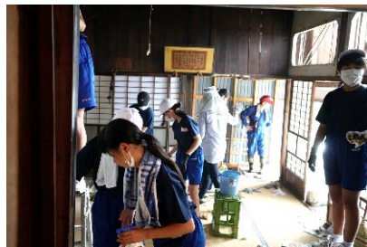
地元住民や学生と空き家の清掃