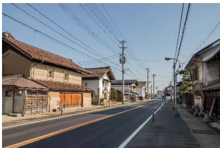
無電柱化による景観整備の効果

平成25年度に「暮らし続けられるまちづくり」をコンセプトとした「小田付地区まちづくり整備計画」が策定されました。小田付の歴史や文化、伝統を活かしながら、生活者や歩行者にとって安全・安心な道路空間を整備するため、平成27年度より、街なみ環境整備事業を活用した消雪施設整備と無電柱化事業が実施されました。今後は、街路灯の設置や側溝の整備、道路の美装化を予定しています。