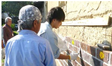
高校生による蔵の修復

平成15年に発足した同団体は、地域住民が主体となり、地元学生や大学、他団体と連携しながら、町並み保存と蔵文化の継承、地域の活性化を目的とした活動を展開してきました。今後も地区の保存団体として、様々な事業の展開を図ります。