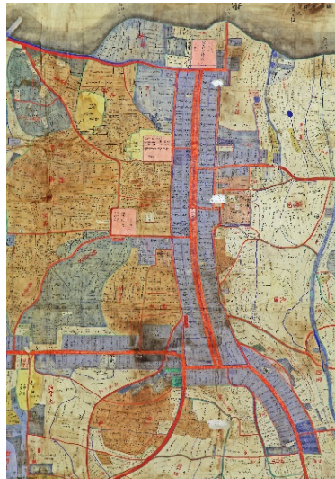
【推定明治4年】 岩代国耶麻郡小田付村絵図