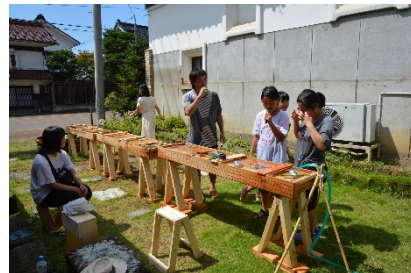
水は重要なキーワード