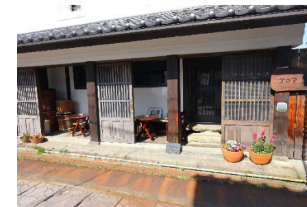
蔵を利用した情報発信基地

より魅力あふれるまちづくりを目指して、令和2年4月より活動を開始しました。事務所は、コミュニティスペースとしても運営しています。HPやSNSによる情報発信、地区の賑わい創出のための活動を行っています。